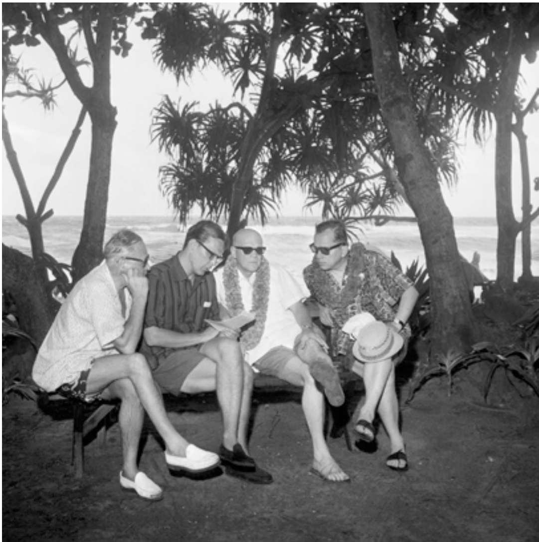
Kalle Kultalan valokuva ylittää teoskynnynksen. Suomen valokuvataiteen museon kokoelmat.

Suomessa tekijänoikeusneuvosto on useissa lausunnoissa käsitellyt valokuvan teoskynnystä. Lausuntopyyntö 2013:3 koski lehtikuvaaja Kalle Kultalan ottamaa valokuvaa, jossa Urho Kekkonen seurueineen lukee Neuvostoliiton noottia Havaijilla vuonna 1962. Tekijänoikeusneuvosto katsoi, että valokuva ilmentää dramaattista tunnelmaa, jonka kuvaaja on rakentanut luovilla valinnoilla esimerkiksi valojen käytössä, ajoituksessa, syväterävyydessä sekä kuvan sommittelussa ja rajaamisessa. Suorittamansa kokonaisarvion perusteella tekijänoikeusneuvosto katsoi, että valokuva on tekijänoikeuslain 1 §:ssä tarkoitettu teos. Tekijänoikeusneuvosto piti kuitenkin teoskynnynksen ylittymistä rajatapauksena.